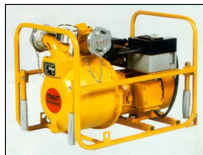
TUP 3-1,5 CL

Wszystkie pompy TUP są dostarczane z wyłącznikiem silnika i wtyczką w wykonaniu przeciwwybuchowym.